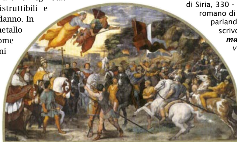
Raffaello Sanzio, Incontro tra Leone Magno e Attila , affresco, 500x750 cm, Stanza di Eliodoro, Palazzi Pontifici, Vaticano

(*) "Inchiodati sui loro cavalli". Ammiano Marcellino (Antiochia di Siria, 330 - 332 circa - Roma, post 397- 400), storico romano di età tardo-imperiale, nel Libro XXXI C. 2, parlando degli Unni, che non usavano le staffe, scrive: " Gli avreste detti inchiodati sui piccoli, e mal conformati, ma infaticabili cavalli. Spesso vi tenevano seduti come usano le donne, e vi trattavano d'affari, deliberando, vendendo, comperando, bevendo, mangiando, dormendo appoggiati all'angusto collo della bestia, ed in un profondo sonno ad ogni sorta di sogni abbandonandosi. "